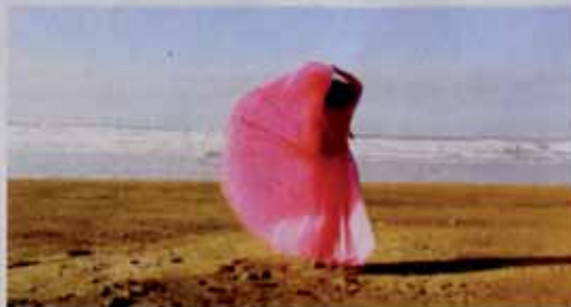
Photogramme extrait d'une vidéo signée Sandra Ancelet.