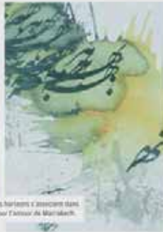
Phonora artistes de divers horizons s'associant dans une expo remarquable - pour l'histoire de Marrakech.

Cinquante artistes de divers horizons s'associant dans une expo remarquable - pour l'histoire de Marrakech. Cette exposition, qui s'inscrit dans le cadre de la promotion de l'art, du beau et de l'authenticité, est une véritable merveille. Elle rassemble des artistes de divers horizons, de la peinture à la sculpture, de la photographie à la calligraphie. Cette exposition est une véritable merveille. Elle rassemble des artistes de divers horizons, de la peinture à la sculpture, de la photographie à la calligraphie. Cette exposition est une véritable merveille. Elle rassemble des artistes de divers horizons, de la peinture à la sculpture, de la photographie à la calligraphie.